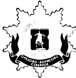
Рисунок нагрудного знака к званию «Почетный житель внутригородского муниципального образования – муниципального округа Орехово-Борисово Северное в городе Москве»

Приложение 3 к решению Совета депутатов внутригородского муниципального образования – муниципального округа Орехово-Борисово Северное в городе Москве от 18 февраля 2025 года № 01-06-08/25